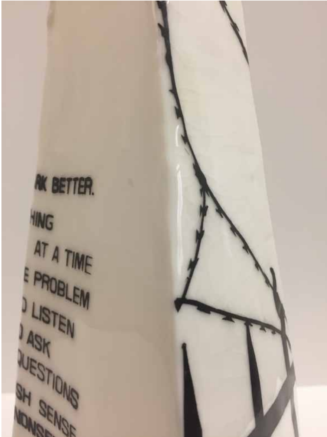
Whats up 1 (Detail)

2017, ca. 37 x 17,5 x 17,5 cm, Porzellan, glasiert, mit Siebdruck übertragene Motive / porcelain, glazed, with silkscreen transferred motifs