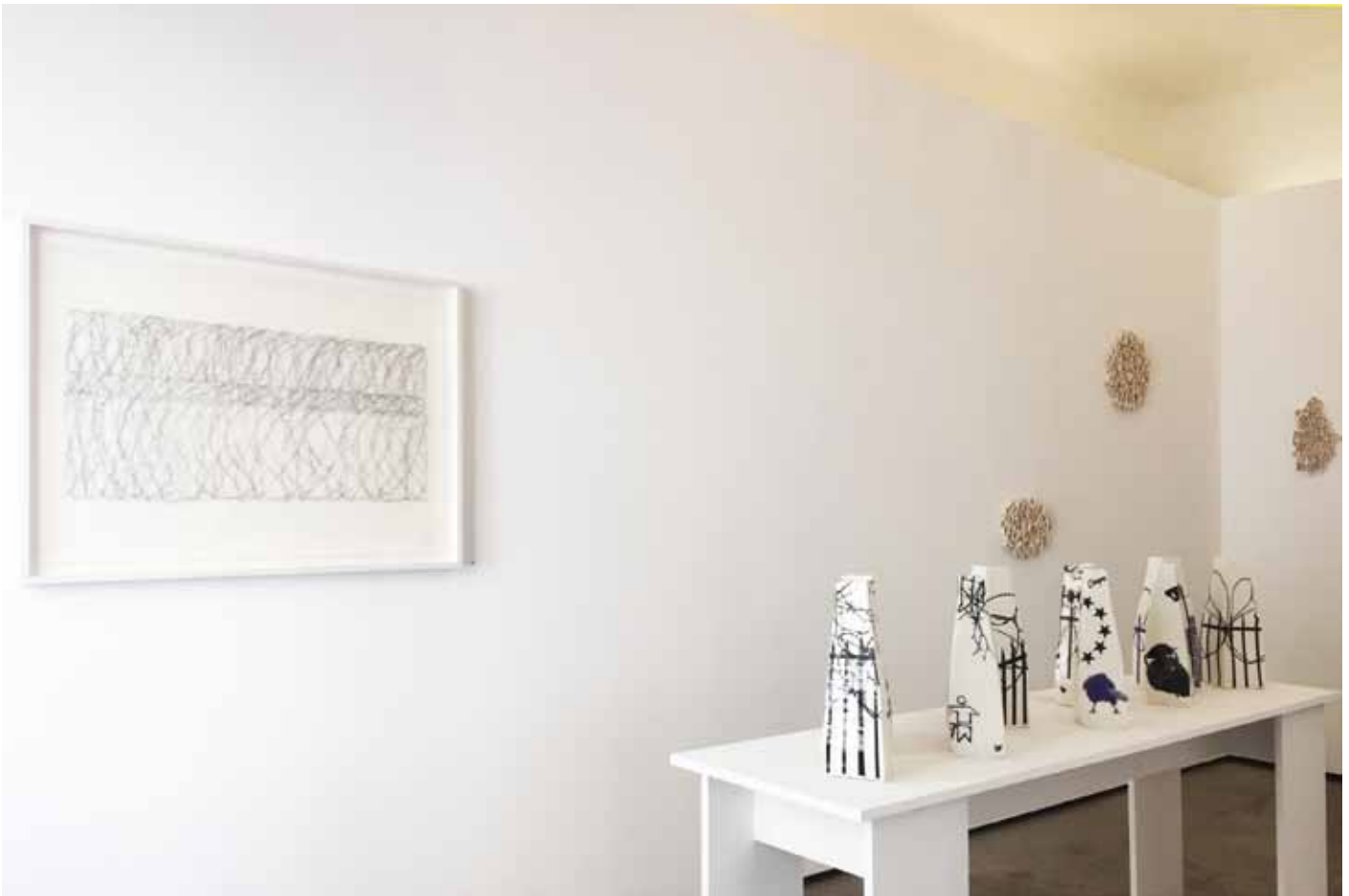
Ausstellungsansicht von gedanken machen mit Porzellan-Gefäßobjekten, Keramikwerken und Stickwerken im Straßen-Salon, Semjon Contemporary, 2017 / Exhibition view of making/thoughts with porcelain and ceramic works as well as with the Stitchwork Windungen / Twists