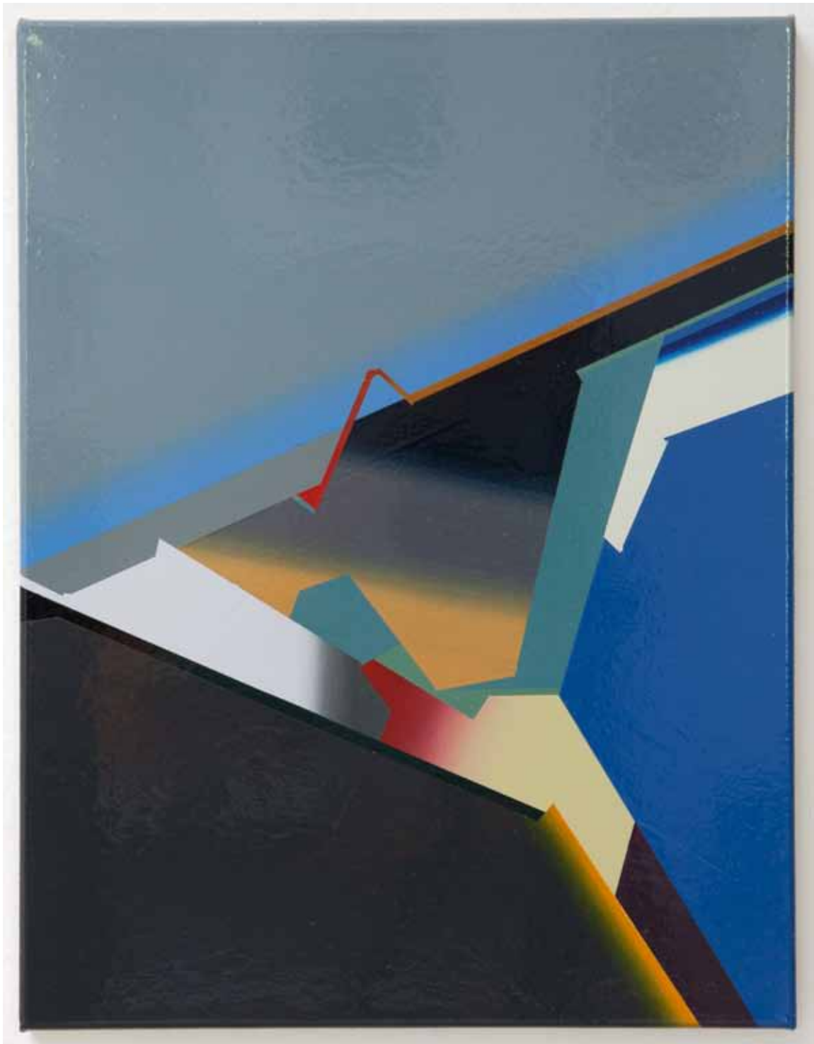
Marc von der Hocht Shaper 2015, 52 x 40 cm Gloss enamel on cotton

SEMJON CONTEMPORARY GALERIE FÜR ZEITGENÖSSISCHE KUNST