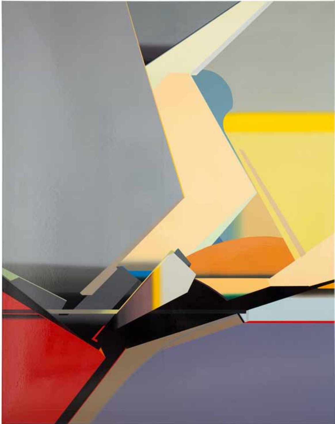
Marc von der Hocht Warp 2014, 190 x 150 cm Gloss enamel on cotton

SEMJON CONTEMPORARY GALERIE FÜR ZEITGENÖSSISCHE KUNST