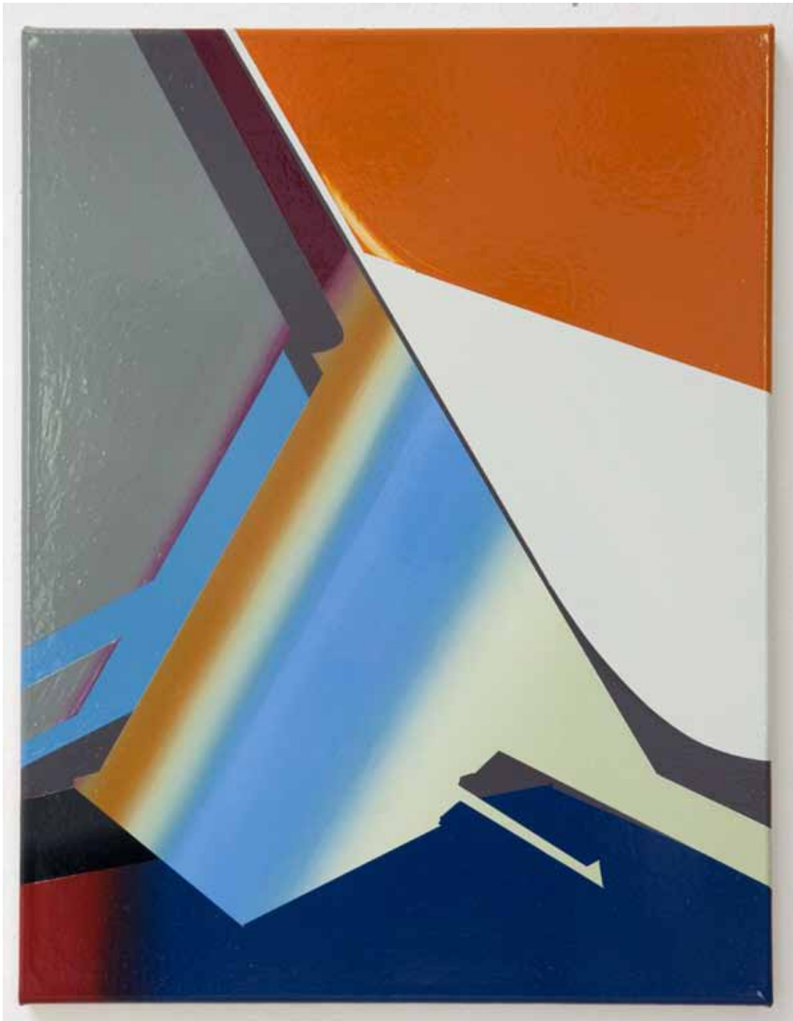
Marc von der Hocht System 2015, 52 x 40 cm Gloss enamel on cotton

SEMJON CONTEMPORARY GALERIE FÜR ZEITGENÖSSISCHE KUNST