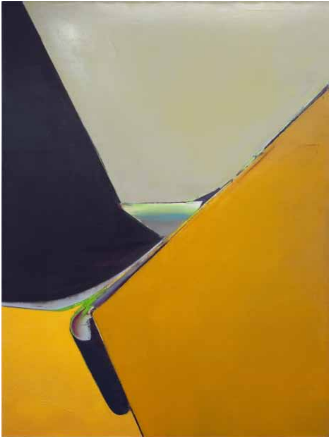
Marc von der Hocht Delta 2012, 200 x 150 cm Gloss enamel and marker on cotton

SEMJON CONTEMPORARY GALERIE FÜR ZEITGENÖSSISCHE KUNST