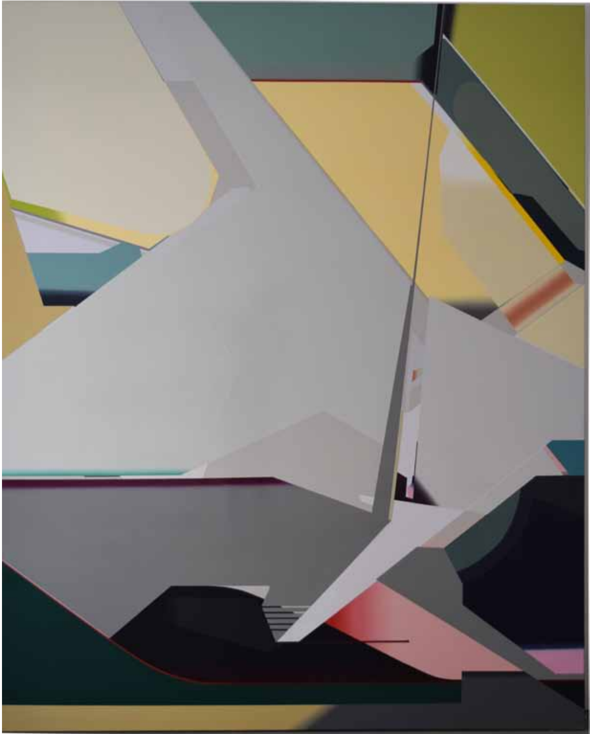
Marc von der Hocht Tindar 2015, 250 x 200 cm Gloss enamel on cotton Photo: provisional