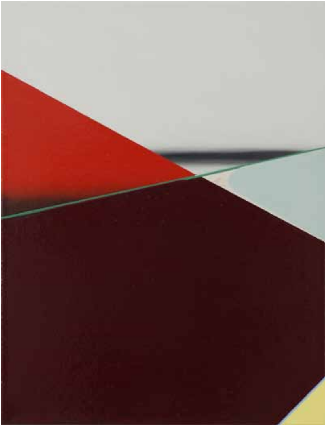
Marc von der Hocht Init 2013, 52 x 40 cm Gloss enamel and marker on cotton

SEMJON CONTEMPORARY GALERIE FÜR ZEITGENÖSSISCHE KUNST