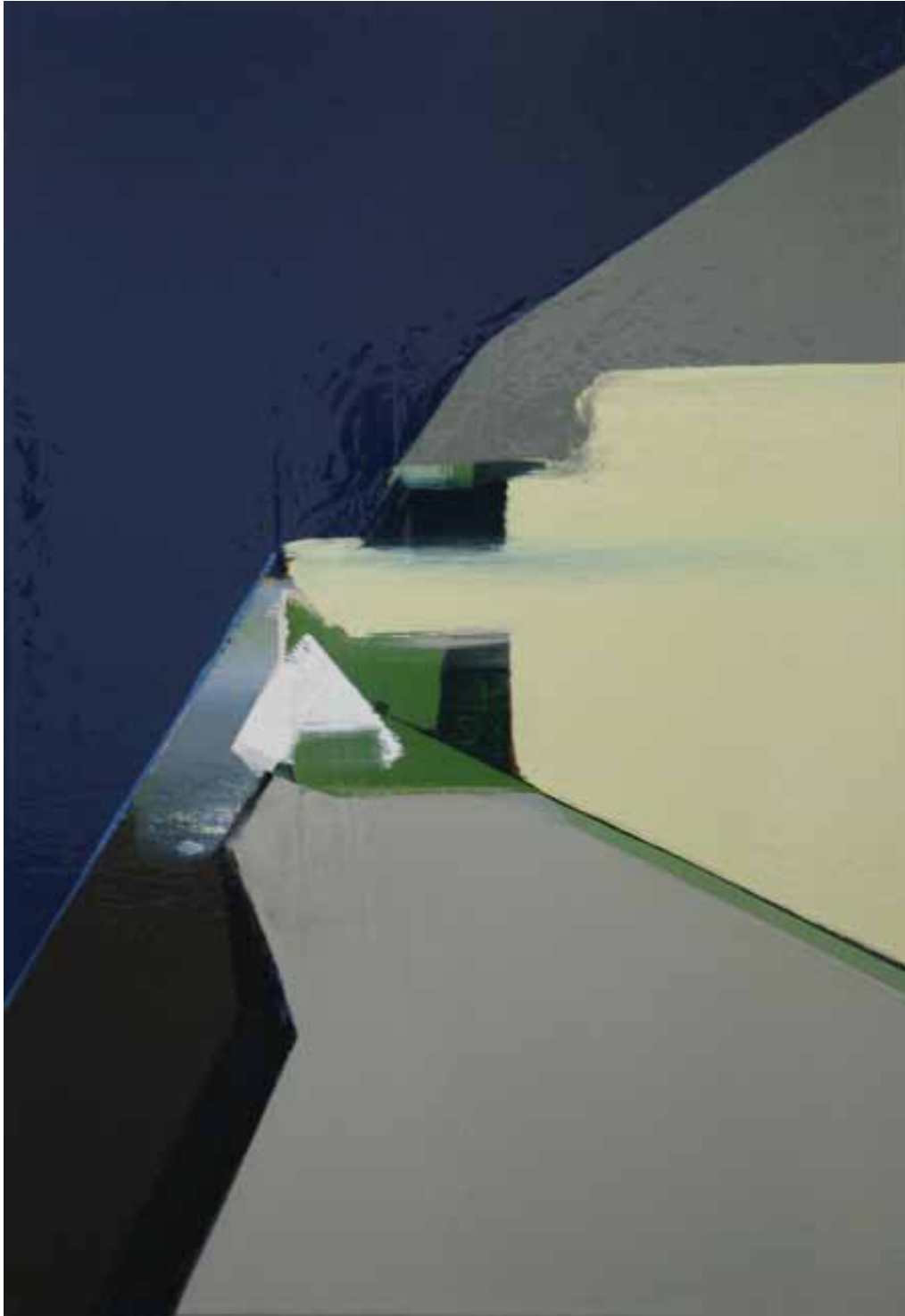
Marc von der Hocht Detail 2013, 65,5 x 45 cm Gloss enamel and marker on cotton