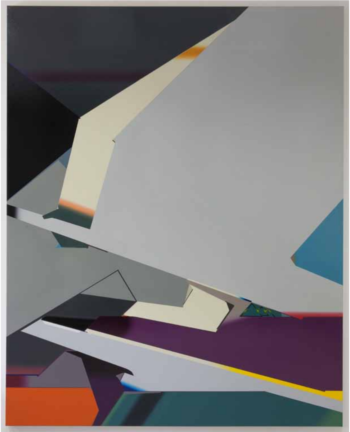
Marc von der Hocht Solid 2015, 250 x 200 cm Gloss enamel on cotton

SEMJON CONTEMPORARY GALERIE FÜR ZEITGENÖSSISCHE KUNST