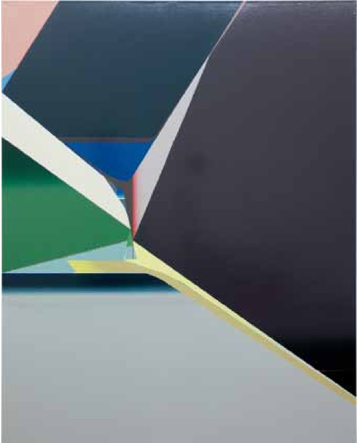
Marc von der Hocht Scope 2014, 200 x 160 cm Gloss enamel on cotton

SEMJON CONTEMPORARY GALERIE FÜR ZEITGENÖSSISCHE KUNST