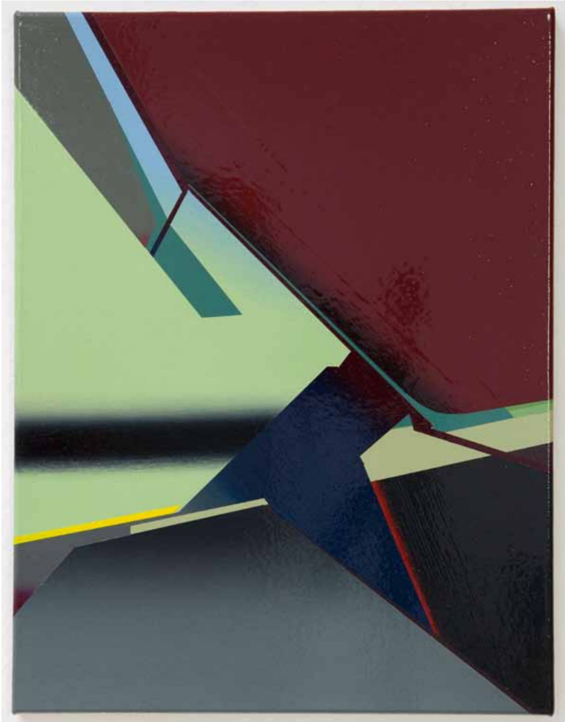
Marc von der Hocht Socket 2015, 52 x 40 cm Gloss enamel on cotton

SEMJON CONTEMPORARY GALERIE FÜR ZEITGENÖSSISCHE KUNST