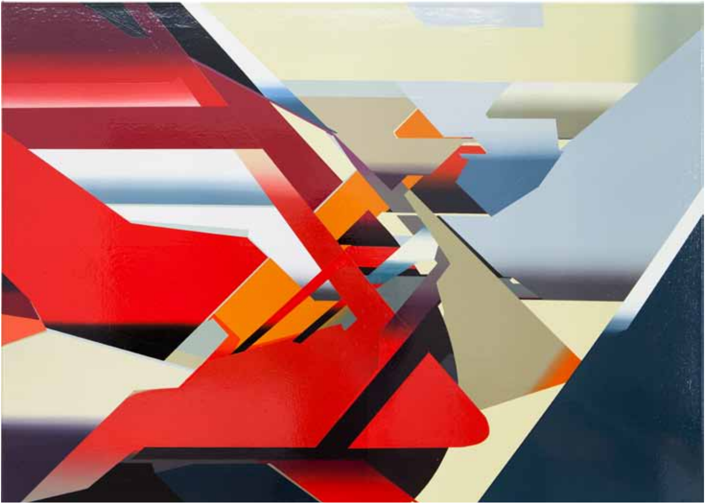
Marc von der Hocht Setup 2014, 80 x 110 cm Gloss enamel on cotton

SEMJON CONTEMPORARY GALERIE FÜR ZEITGENÖSSISCHE KUNST