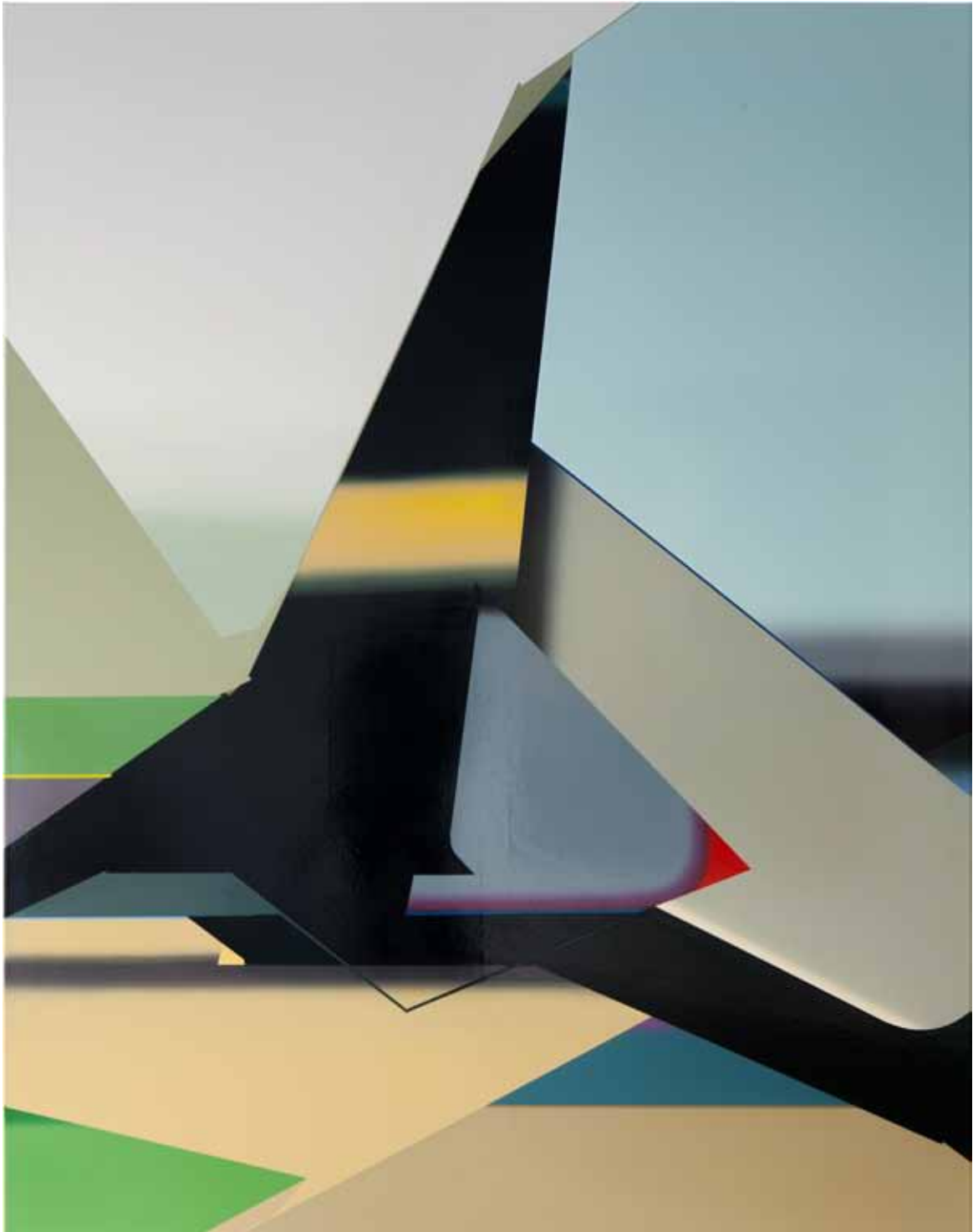
Marc von der Hocht Girder 2014, 190 x 150 cm Gloss enamel on cotton

SEMJON CONTEMPORARY GALERIE FÜR ZEITGENÖSSISCHE KUNST