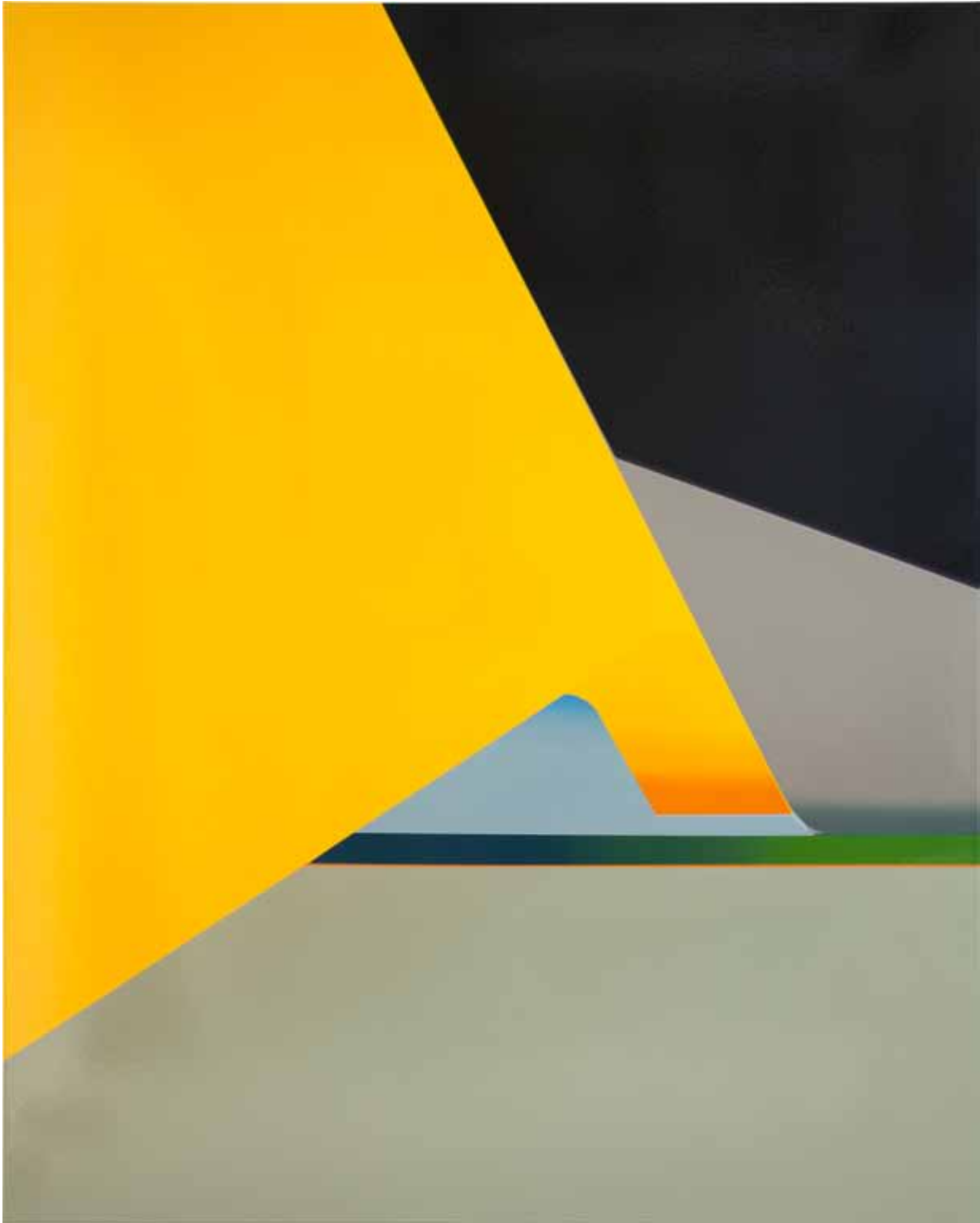
Marc von der Hocht Tack 2014, 200 x 160 cm Gloss enamel on cotton

SEMJON CONTEMPORARY GALERIE FÜR ZEITGENÖSSISCHE KUNST