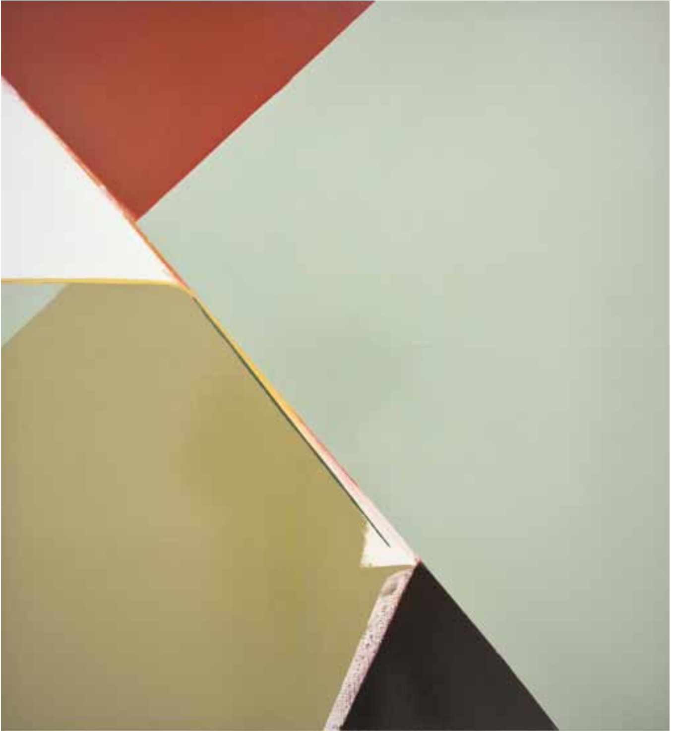
Marc von der Hocht Sluice 2013, 100 x 90 cm Gloss enamel and marker on cotton