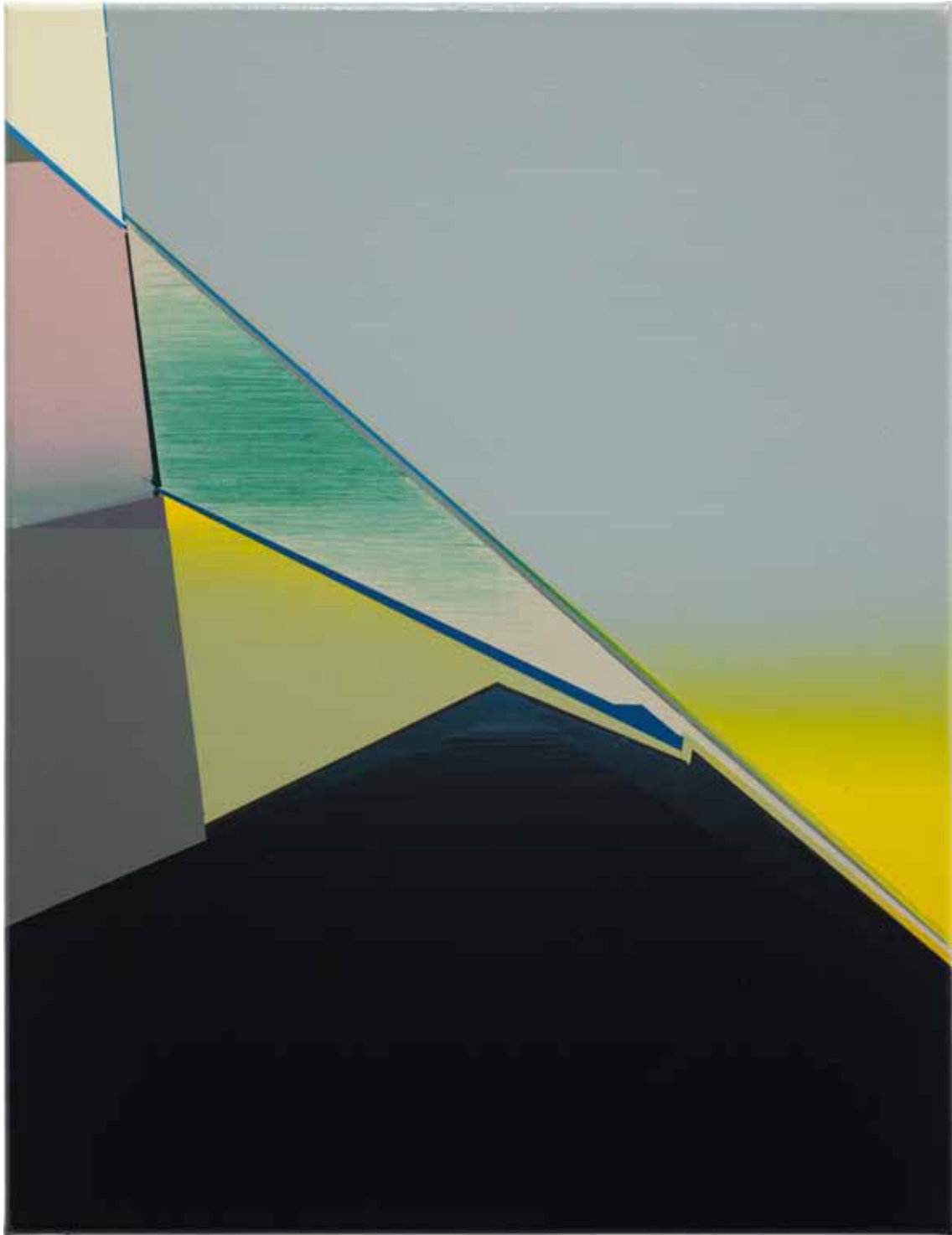
Marc von der Hocht Pound 2014, 52 x 40 cm Gloss enamel on cotton

SEMJON CONTEMPORARY GALERIE FÜR ZEITGENÖSSISCHE KUNST