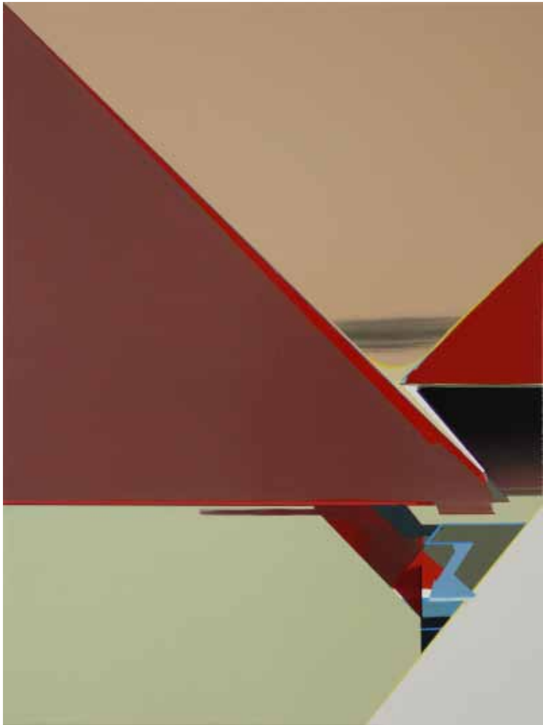
Marc von der Hocht Section 2013, 100 x 75 cm Gloss enamel and marker on cotton

SEMJON CONTEMPORARY GALERIE FÜR ZEITGENÖSSISCHE KUNST