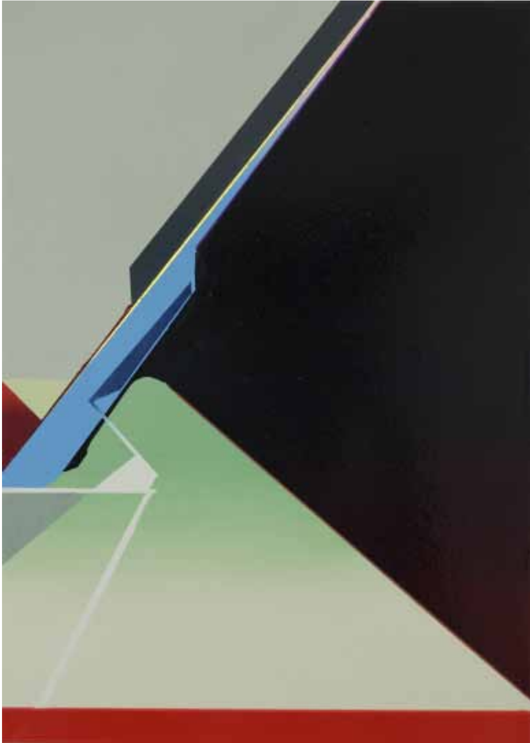
Marc von der Hocht Patch 2013, 70 x 50 cm Gloss enamel and marker on cotton