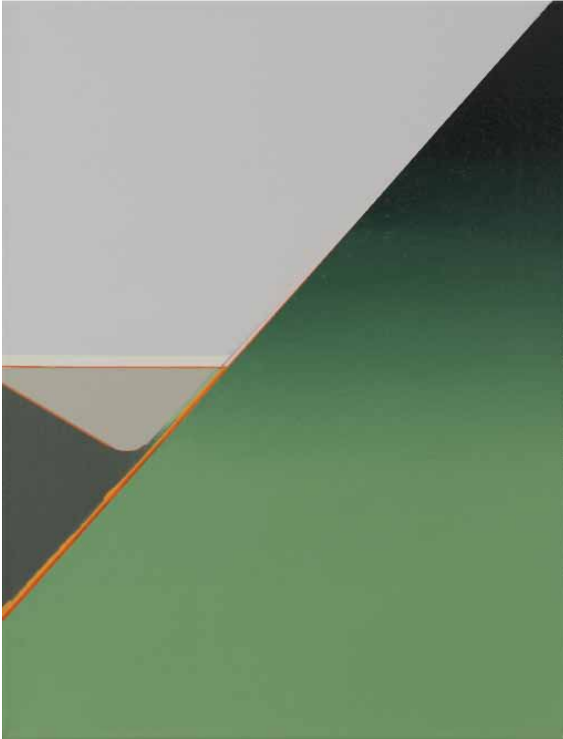
Marc von der Hocht Narrow 2013, 52 x 40 cm Gloss enamel and marker on cotton

SEMJON CONTEMPORARY GALERIE FÜR ZEITGENÖSSISCHE KUNST