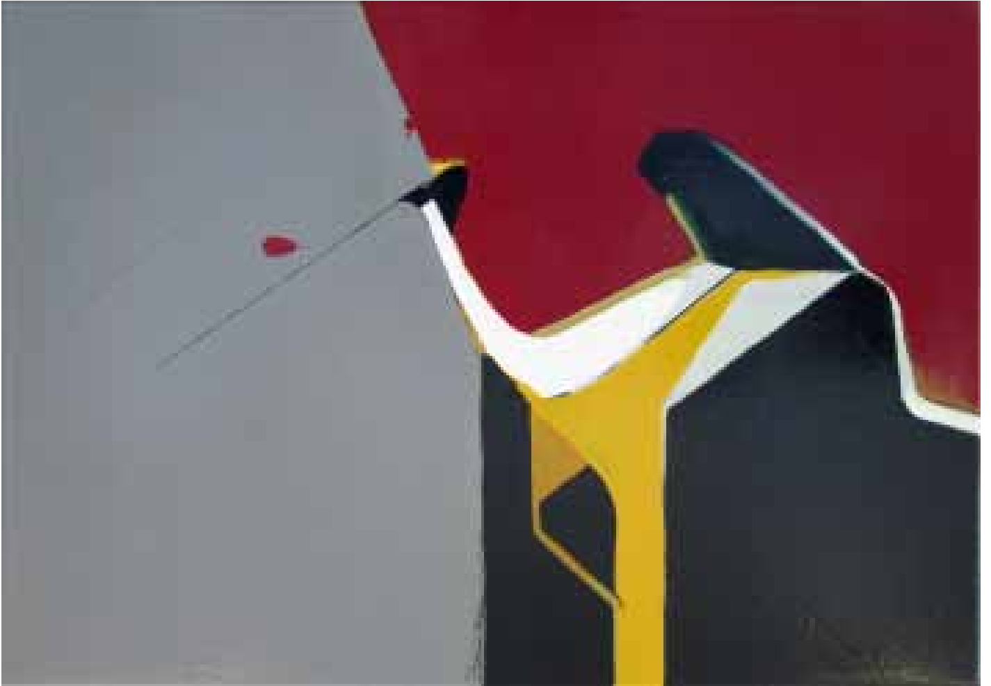
Marc von der Hocht Mittler 2012, 70 x 100 cm Gloss enamel and marker on cotton