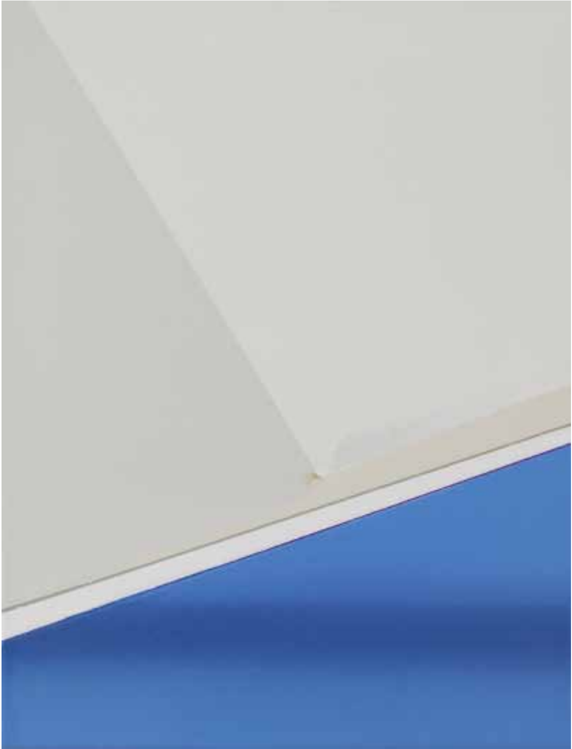
Marc von der Hocht Bruice 2013, 52 x 40 cm Gloss enamel and marker on cotton

SEMJON CONTEMPORARY GALERIE FÜR ZEITGENÖSSISCHE KUNST