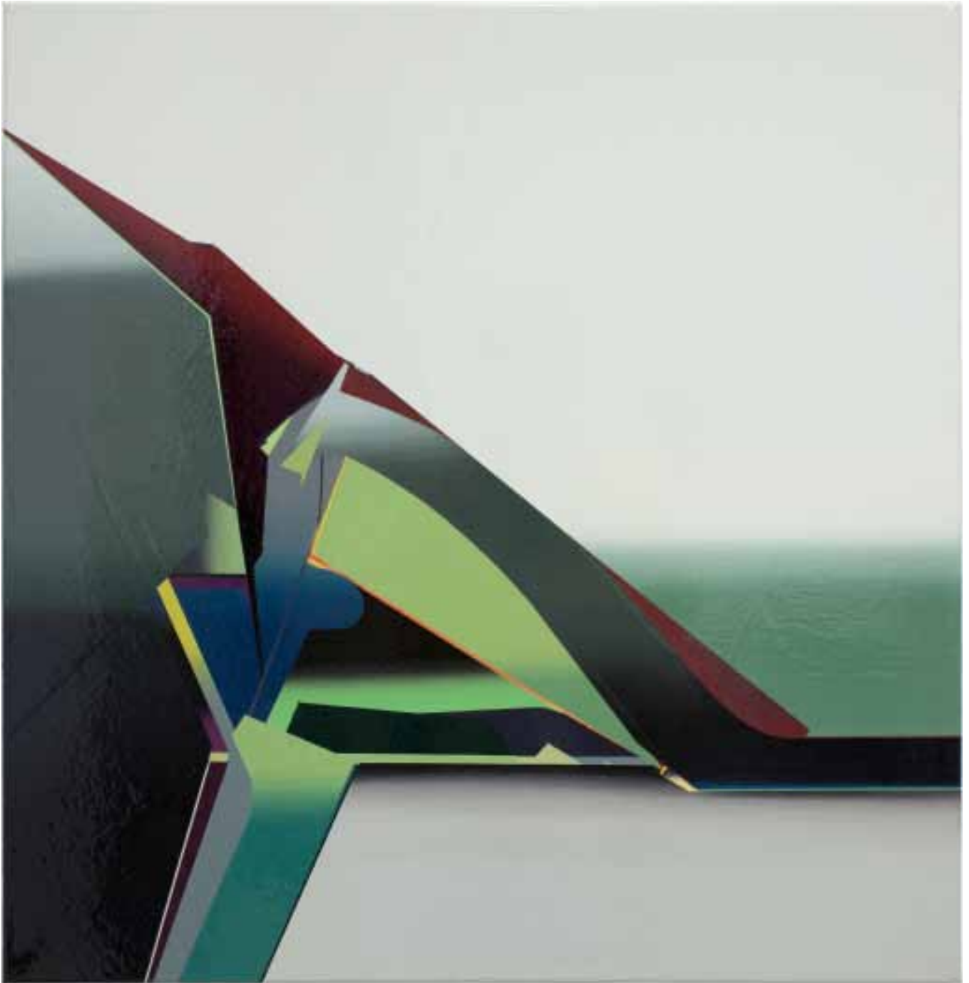
Marc von der Hocht Ortofon 2014, 72 x 70 cm Gloss enamel on cotton

SEMJON CONTEMPORARY GALERIE FÜR ZEITGENÖSSISCHE KUNST