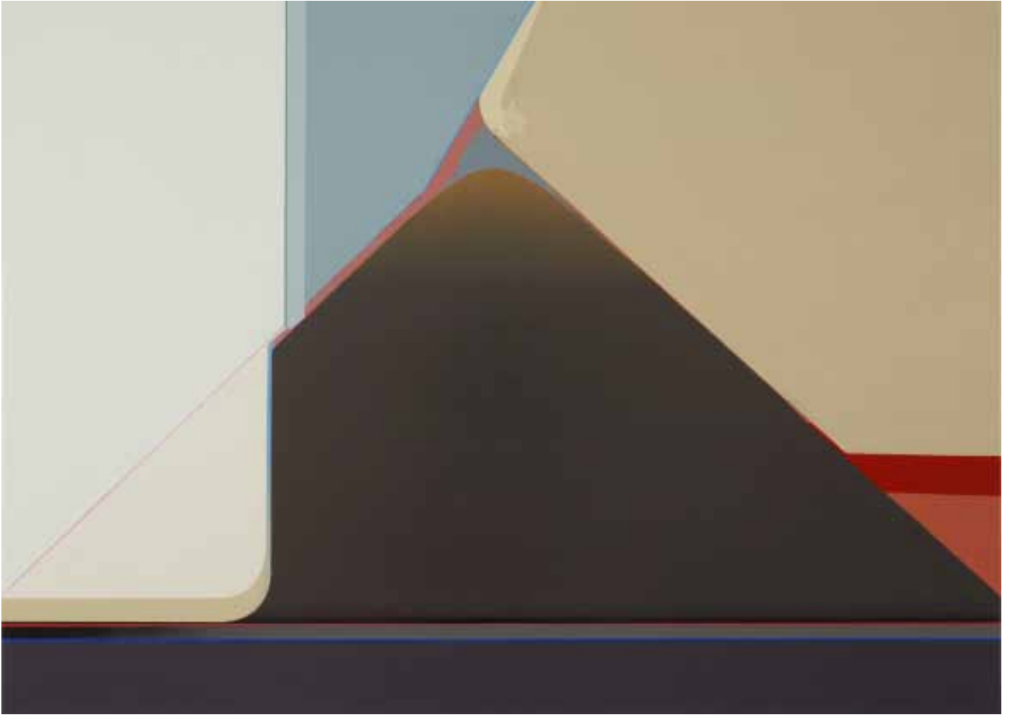
Marc von der Hocht Acme 2013, 100 x 140 cm Gloss enamel and marker on cotton

SEMJON CONTEMPORARY GALERIE FÜR ZEITGENÖSSISCHE KUNST