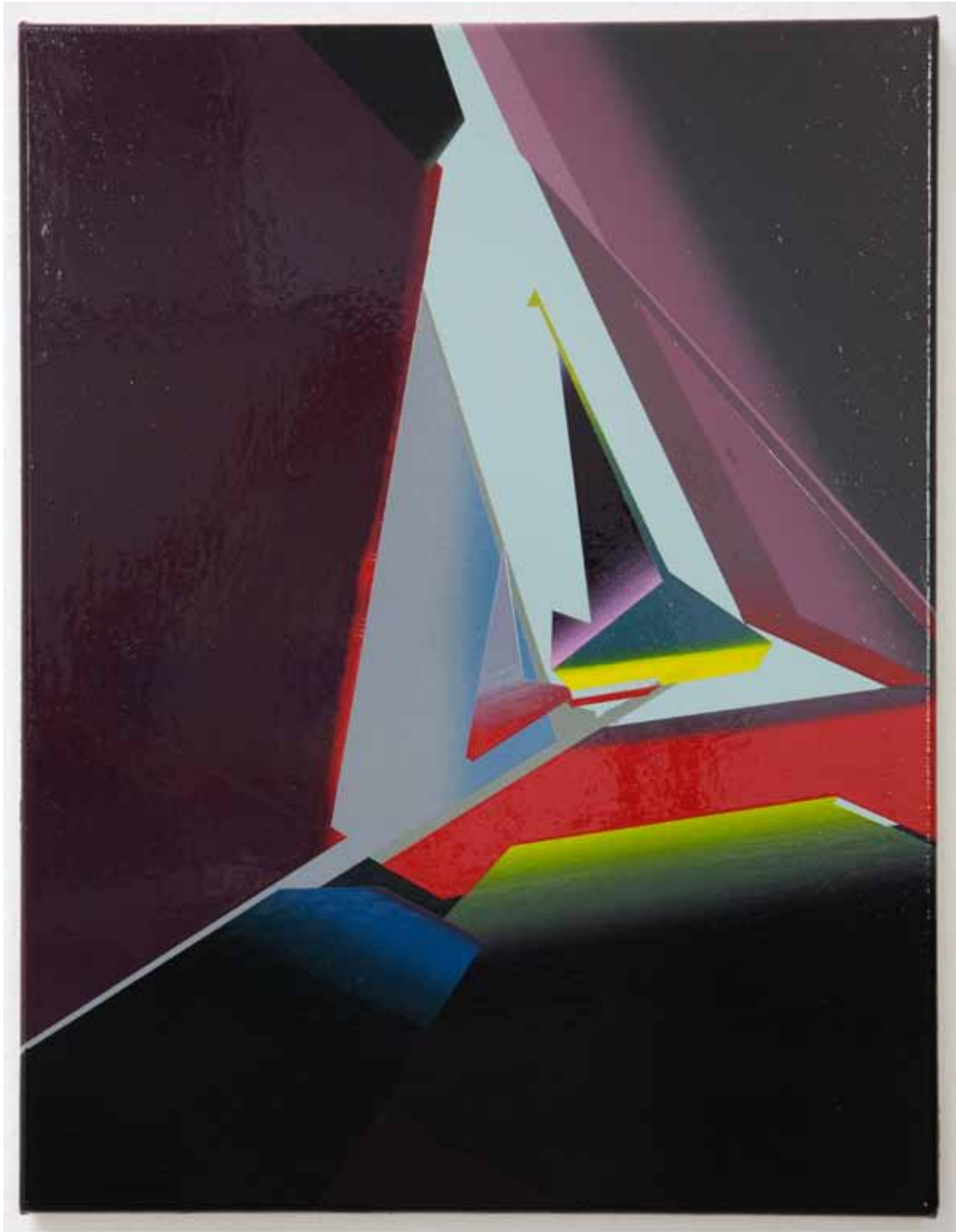
Marc von der Hocht Crystal 2015, 52 x 40 cm Gloss enamel on cotton

SEMJON CONTEMPORARY GALERIE FÜR ZEITGENÖSSISCHE KUNST