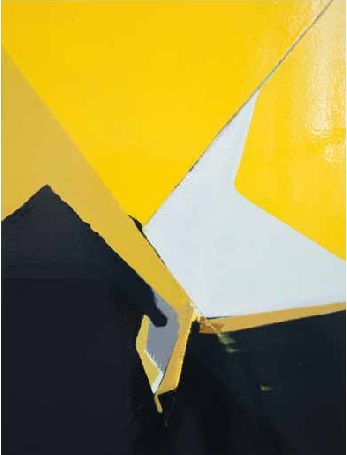
Marc von der Hocht Vertigo 2012, 80 x 60 cm Gloss enamel and marker on cotton

SEMJON CONTEMPORARY GALERIE FÜR ZEITGENÖSSISCHE KUNST