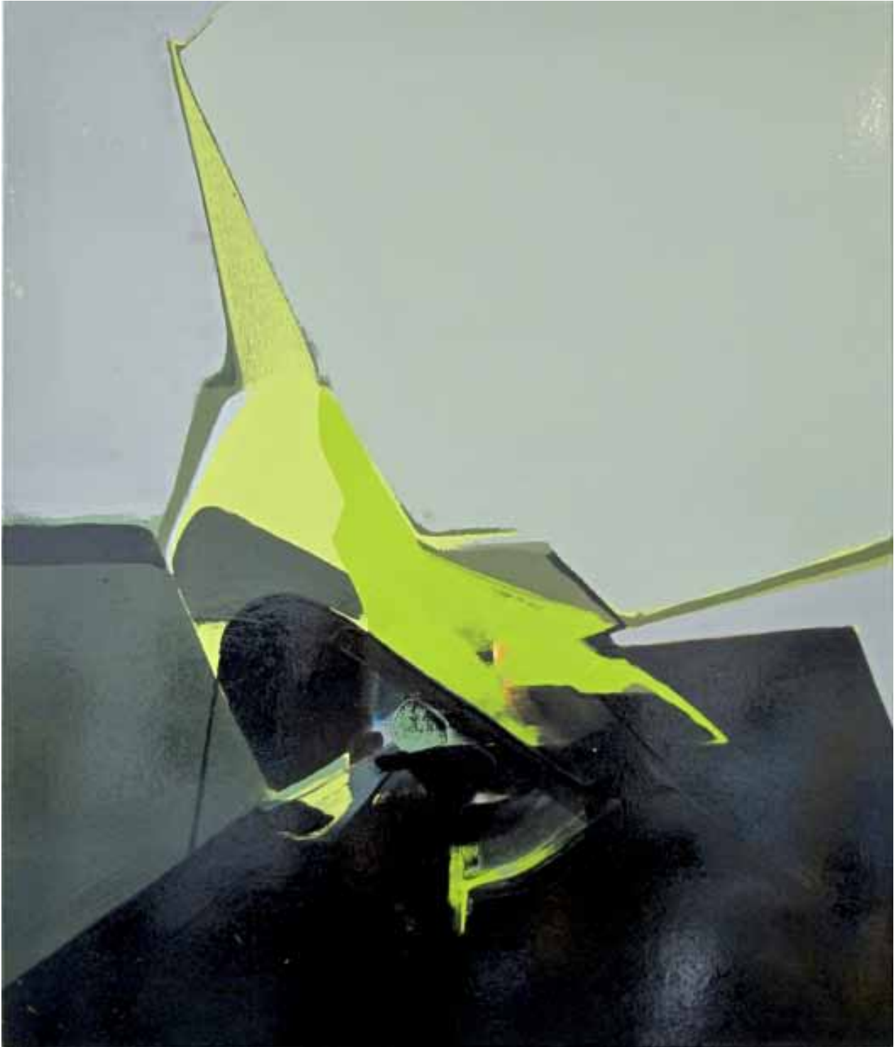
Marc von der Hocht Cricket 2012, 140 x 120 cm Gloss enamel and oil on cotton