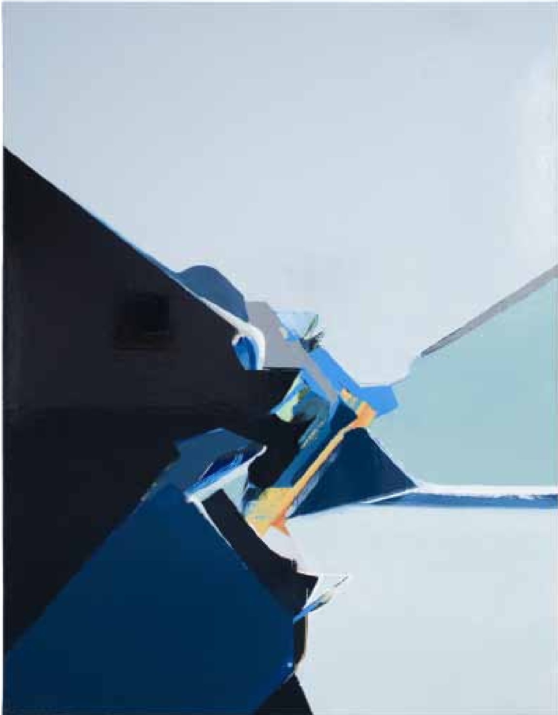
Marc von der Hocht Explorer 2012, 180 x 140 cm Gloss enamel and oil on cotton