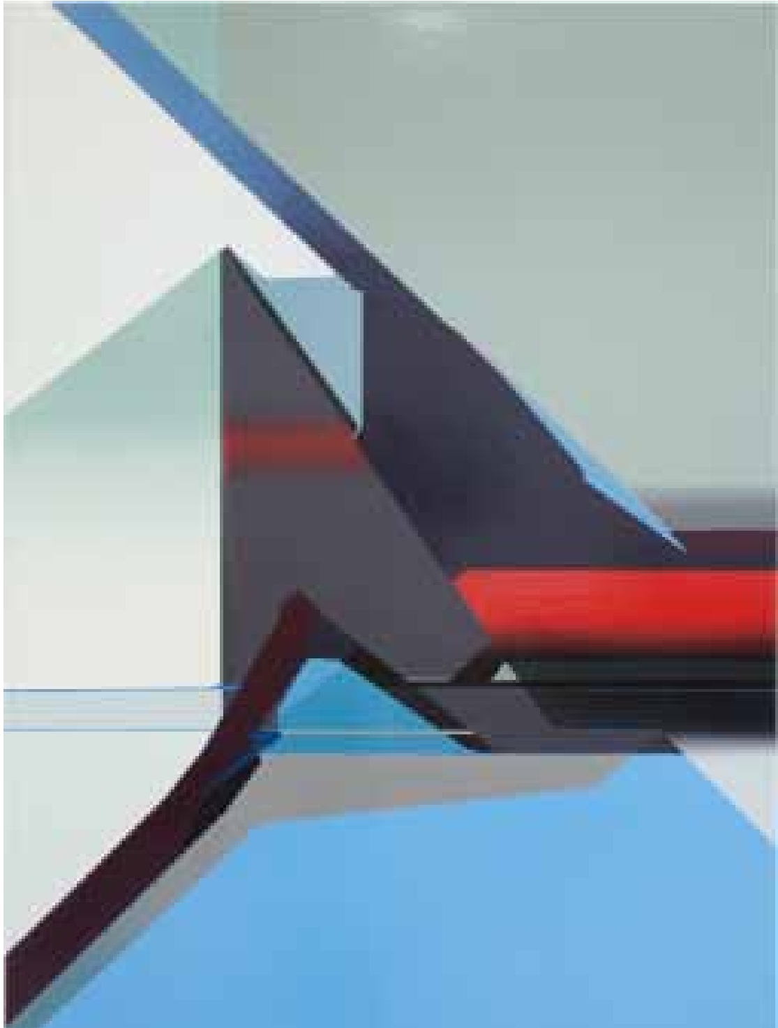
Marc von der Hocht Angle 2014, 150 x 100 cm Gloss enamel on cotton

SEMJON CONTEMPORARY GALERIE FÜR ZEITGENÖSSISCHE KUNST