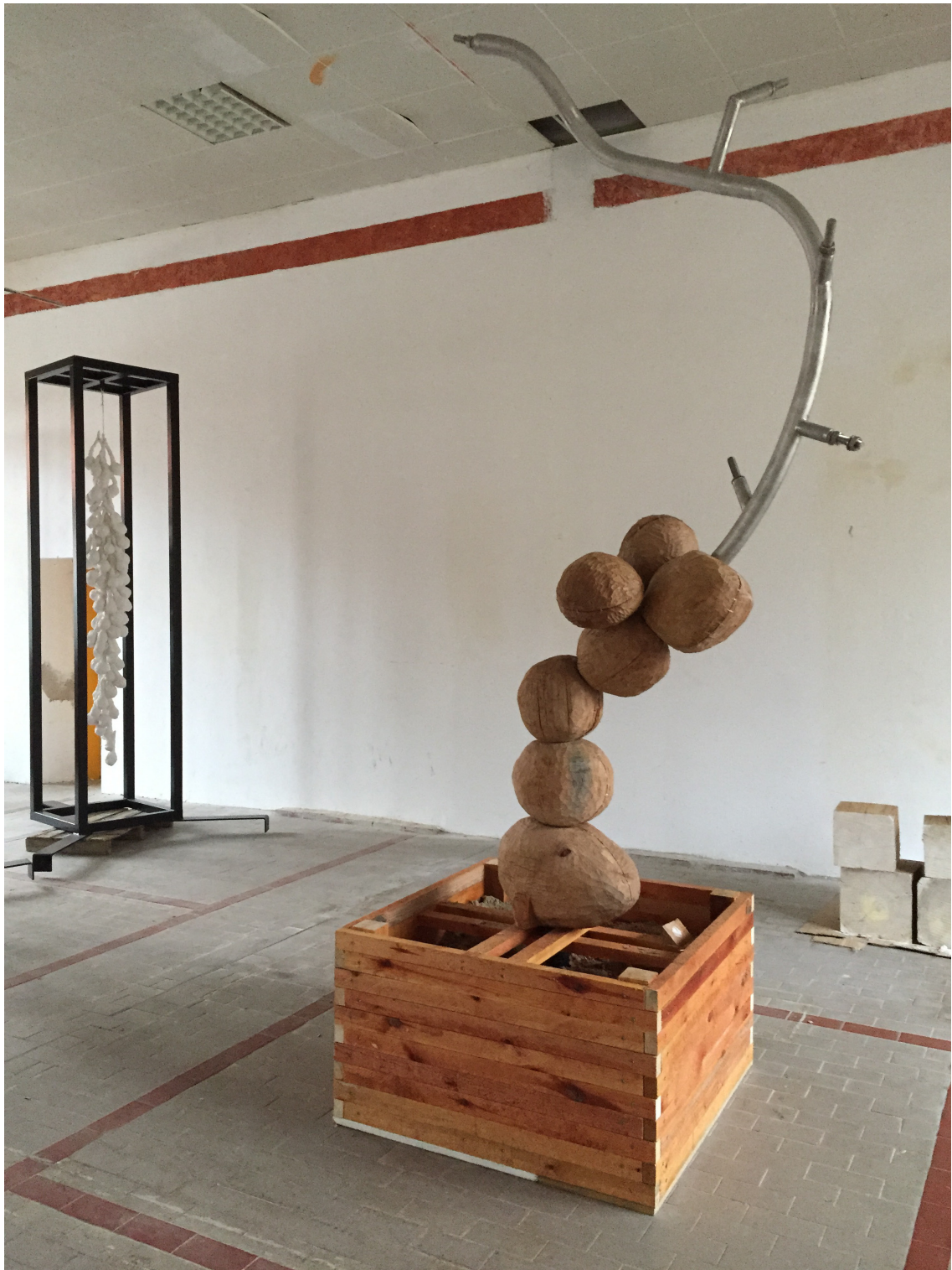
Takayuki Daikoku Atelieransicht mit woodcell im Produktionsprozess für die Dorfäue von Wagenitz, vor dem Schwedenturm Hinten eine fast fertige renmen - Skulptur; Foto: H. N. Semjon, Januar 2015