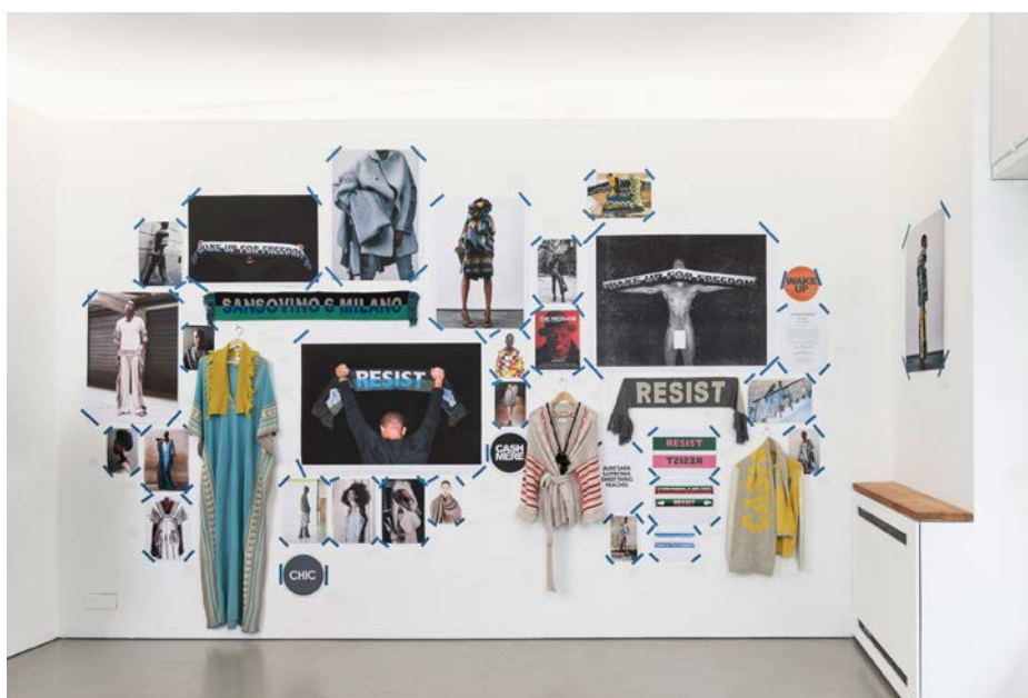
Oben: „Many Shades of Grès“, Entwürfe von Madame Grès und antike Skulpturen; unten: „The Message According To Sansovino6: weaving resilience“, Fotografien und Strickdesigns von Sansovino6