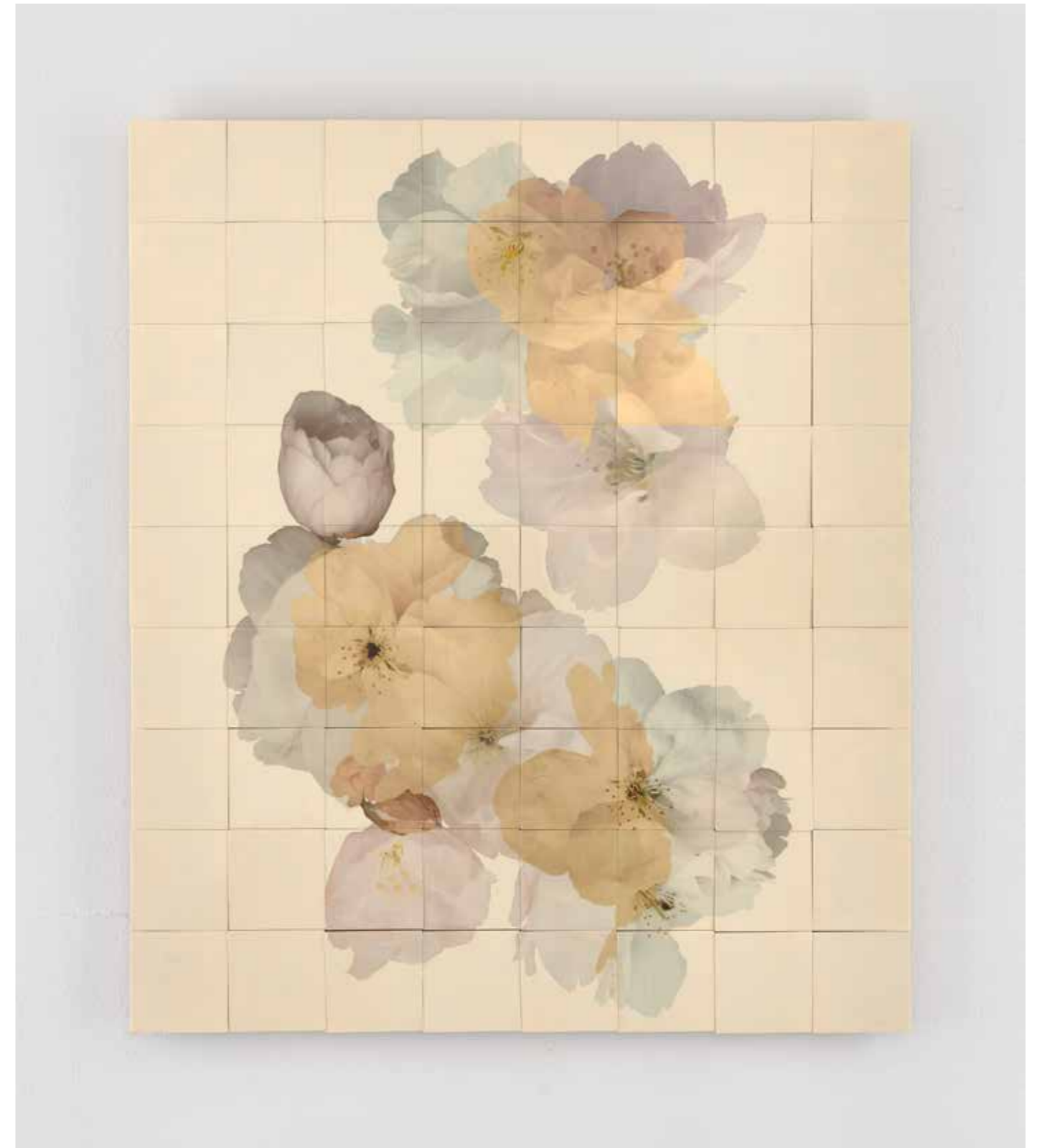
Henrik U. Müller , Kirschblüten weiß (Elfenbein)

2013, 117 Bildtäfelchen, 176,5 x 117 cm, UV-resistente Transferfolie, Compositions-gold, Lack, Birkensperrholz | 117 panels, 176,5 x 117 cm, UV resistant transfer foil, Composition gold, lacquer, birch plywood