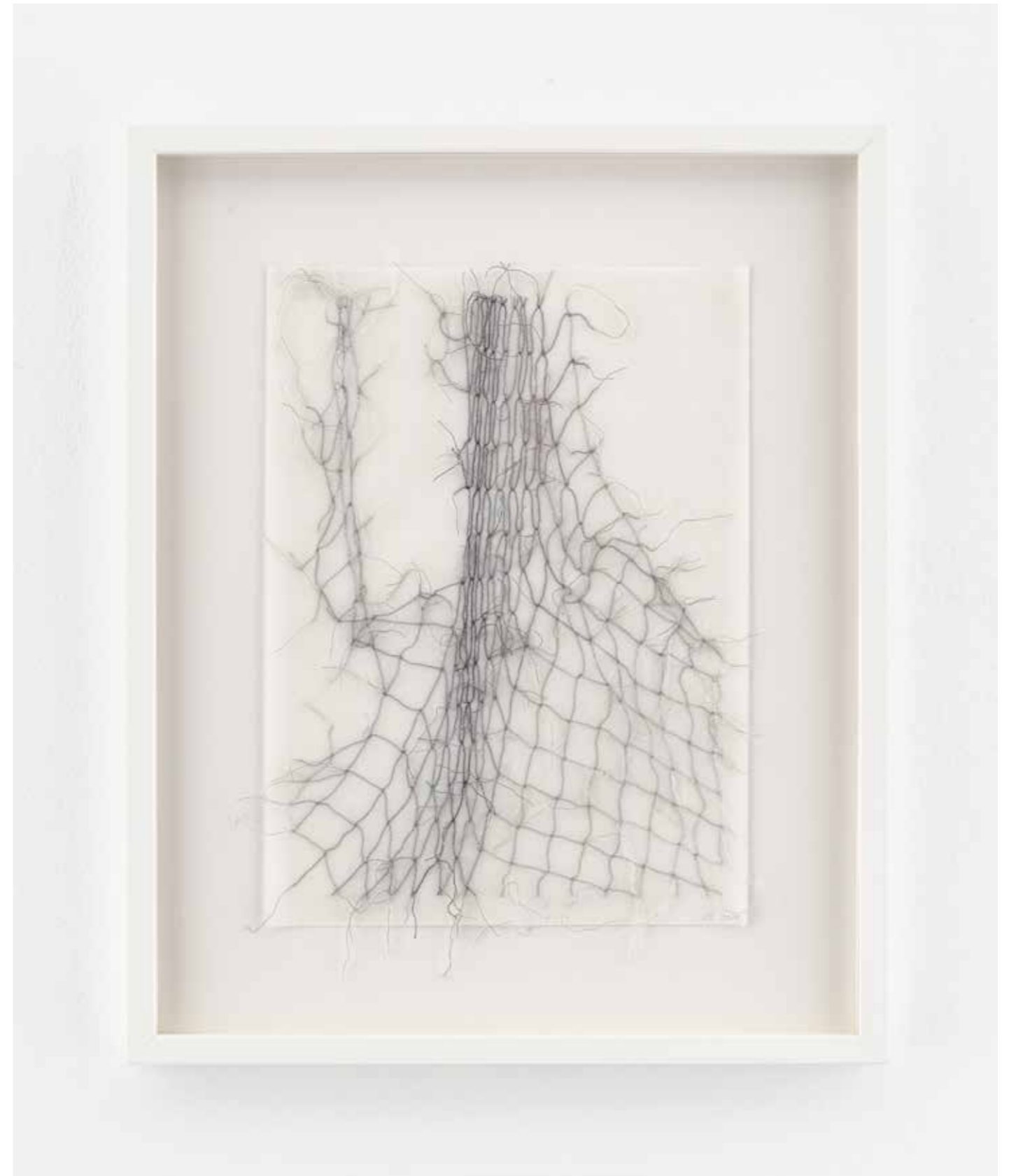
Ute Essig, Netz 4

2018, 52,4 x 42,4 cm (gerahmt | framed), Stickgarn auf Japan-Papier | embroidery thread on Japan paper