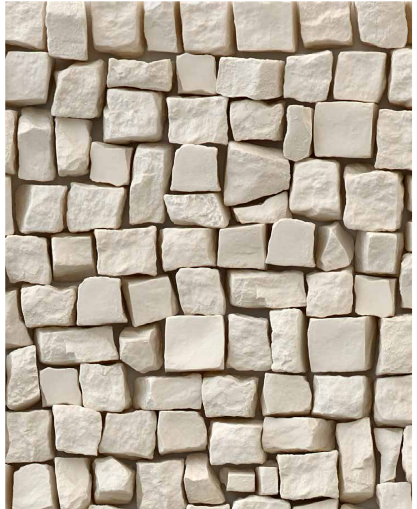
Ute Essig , 1 qm Berlin (Limoges-Porzellan) , Detail

2005/2024, 100 x 100 x 10 cm, Limoges-Porzellan (Hochbrand), Holz, Farbe, Klettkeleband | Limoges porcelain (high firing), wood, paint, velcro