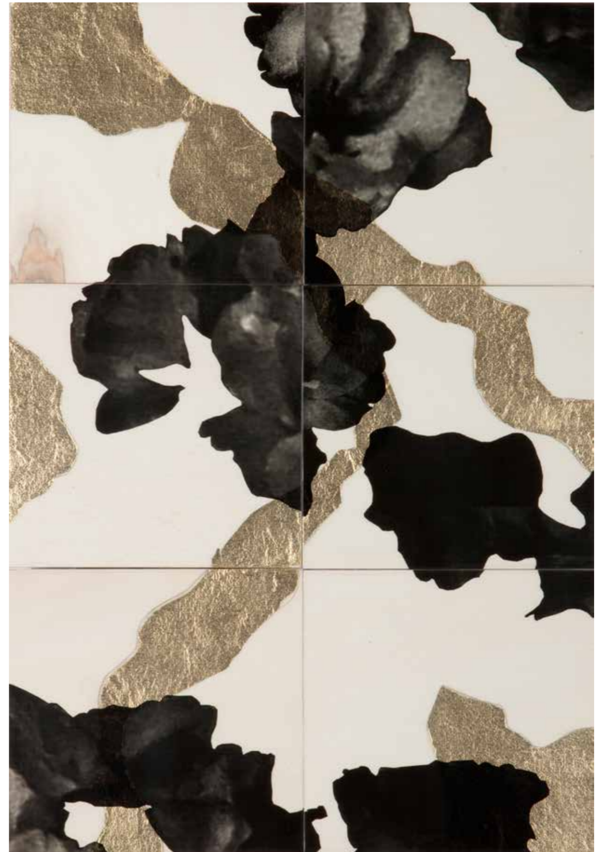
Henrik U. Müller , Kirschblüten weiß (Elfenbein)

2014, 28 Bildtäfelchen ca. 94,5 x 52,5 cm, UV-resistente Transferfolie, Compositgold, Lack auf Birkensperrholz | 28 picture panels, 94,5 x 52,5 cm, UV resistant transfer foil, Composition gold, enamel on birch plywood