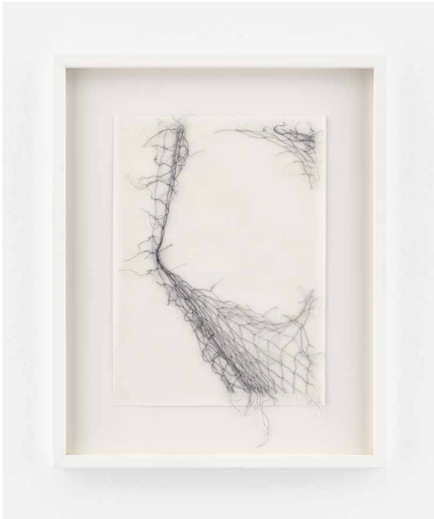
Ute Essig, Netz 7

2018, 52,4 x 42,4 cm (gerahmt | framed), Stickgarn auf Japan-Papier | embroidery thread on Japan paper