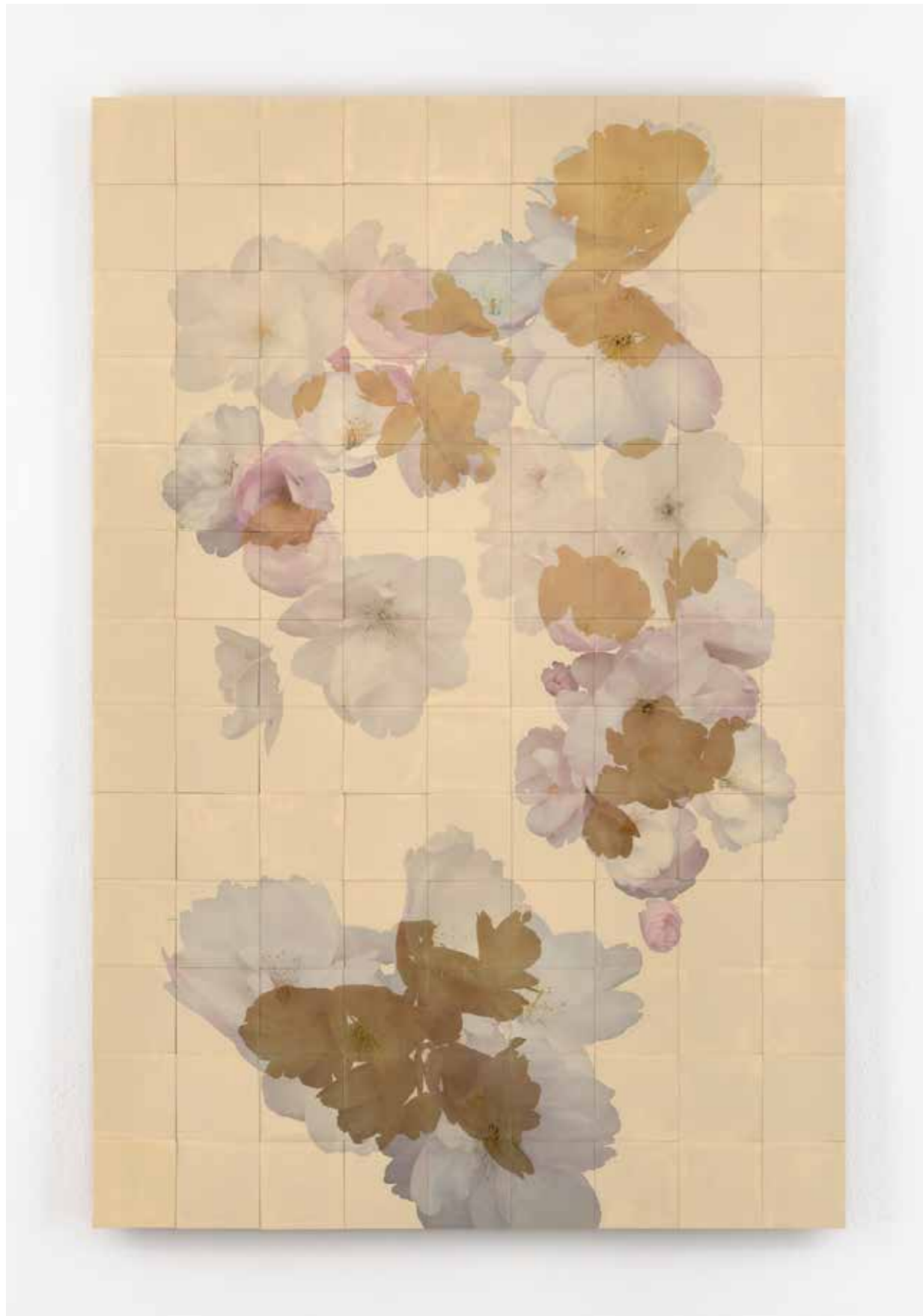
Henrik U. Müller , Kirschblüten weiß (Elfenbein)

2021, 117 Bildtäfelchen, 176,5 x 117 cm, UV-resistente Transferfolie, Compositions-gold, Lack, Birkensperholz | 117 panels, 176,5 x 117 cm, UV resistant transfer foil, Composition gold, lacquer, birch plywood