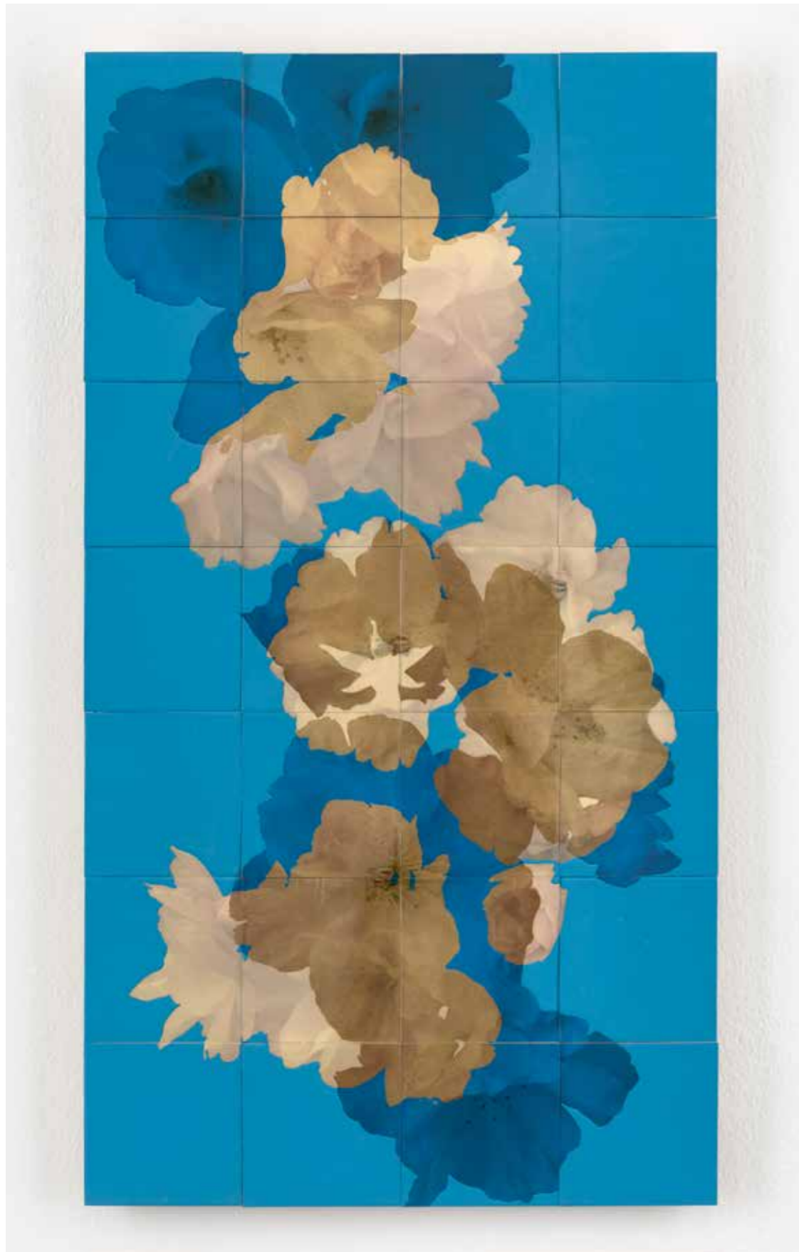
Henrik U. Müller , Kirschblüten blau (Elfenbein)

2014, 28 Bildtäfelchen ca. 94,5 x 52,5 cm, UV-resistente Transferfolie, Compositgold, Lack auf Birkensperrholz | 28 picture panels, 94,5 x 52,5 cm, UV resistant transfer foil, Composition gold, enamel on birch plywood