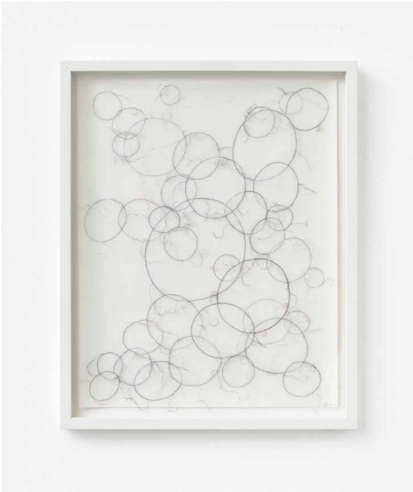
Ute Essig , Circles

2019, 52,4 x 42,4 cm (gerahmt | framed), Stickgarn auf Japan-Papier | embroidery thread on Japan paper