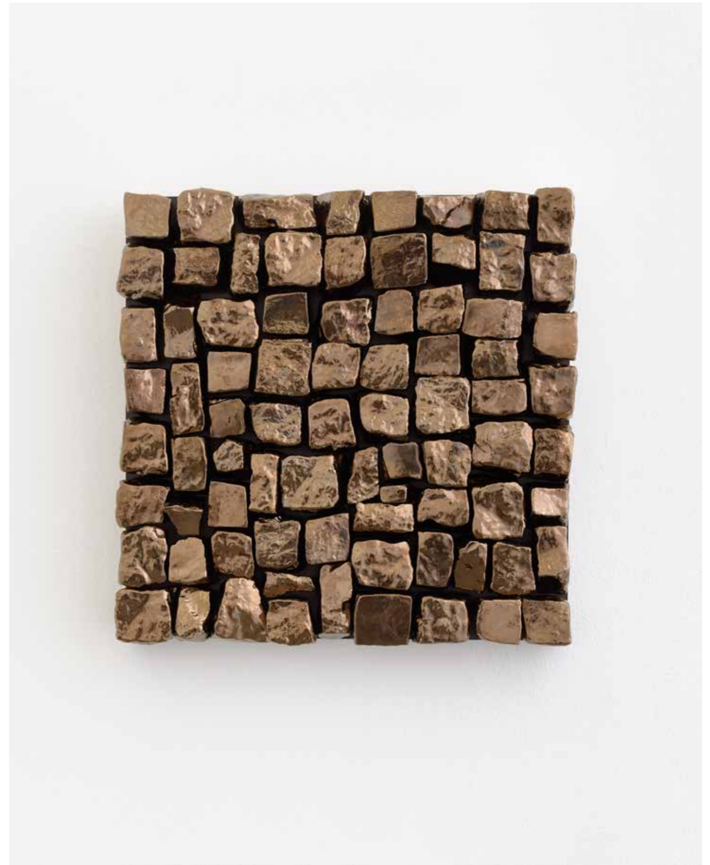
Ute Essig , Berliner Viertel (Antique gold) Nr. 3/4

2019, 52,4 x 42,4 cm (gerahmt | framed), Stickgarn auf Japan-Papier | embroidery thread on Japan paper