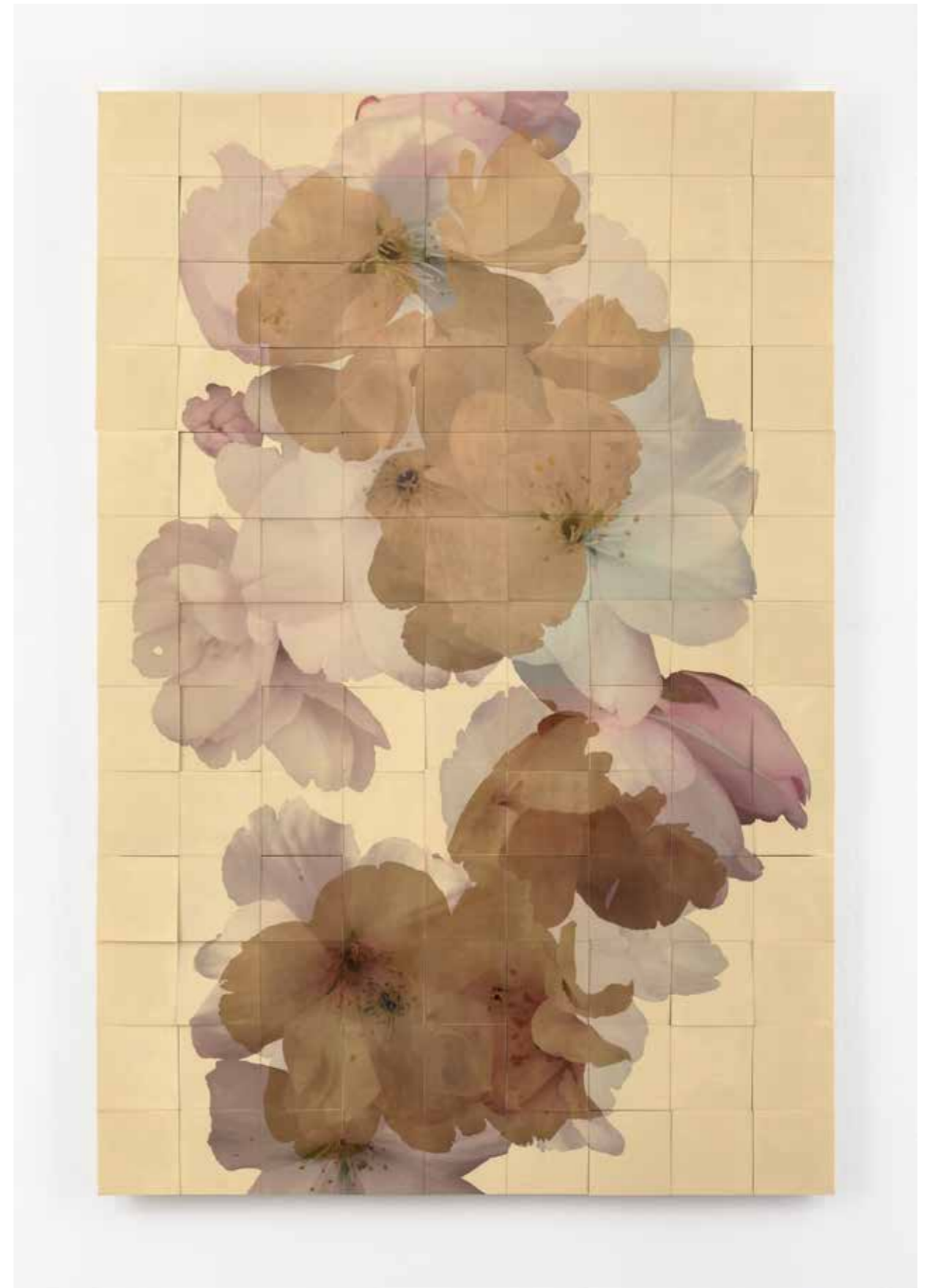
Henrik U. Müller , Kirschblüten weiß (Elfenbein)

2021, 117 Bildtäfelchen, 176,5 x 117 cm, UV-resistente Transferfolie, Compositions-gold, Lack, Birkensperholz | 117 panels, 176,5 x 117 cm, UV resistant transfer foil, Composition gold, lacquer, birch plywood