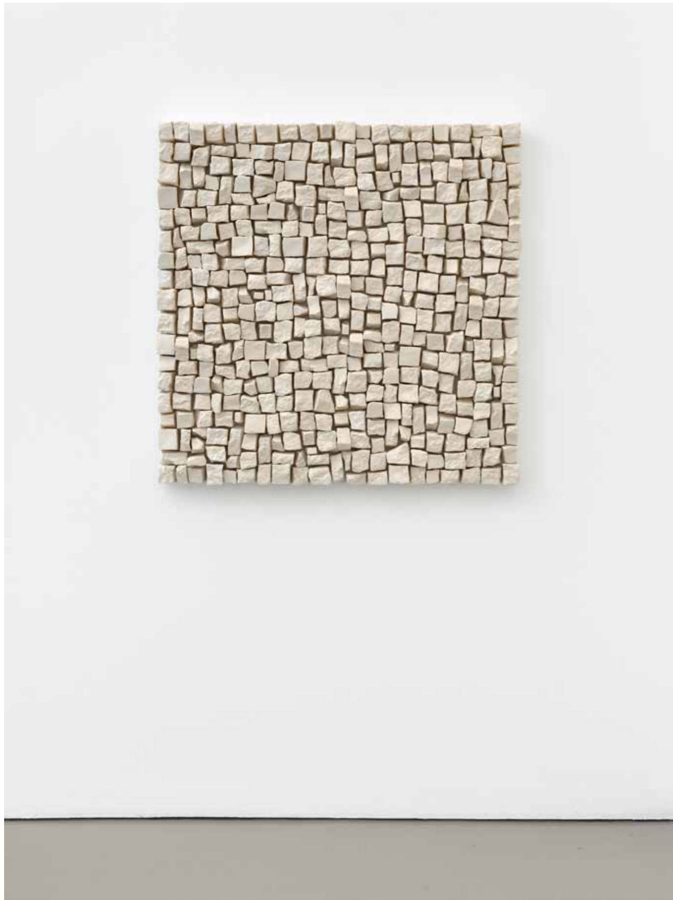
Ute Essig , 1 qm Berlin (Limoges-Porzellan)

2005/2024, 100 x 100 x 10 cm, Limoges-Porzellan (Hochbrand), Holz, Farbe, Klettkeleband | Limoges porcelain (high firing), wood, paint, velcro